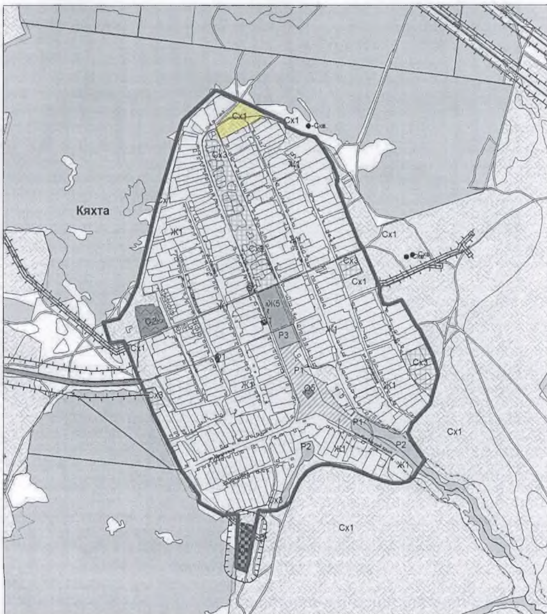
Карта градостроительного зонирования села Кяхта

* Примечание к Карте градостроительного зонирования с. Кяхта сельского поселения Шигоны муниципального района Шигонский Самарской области: