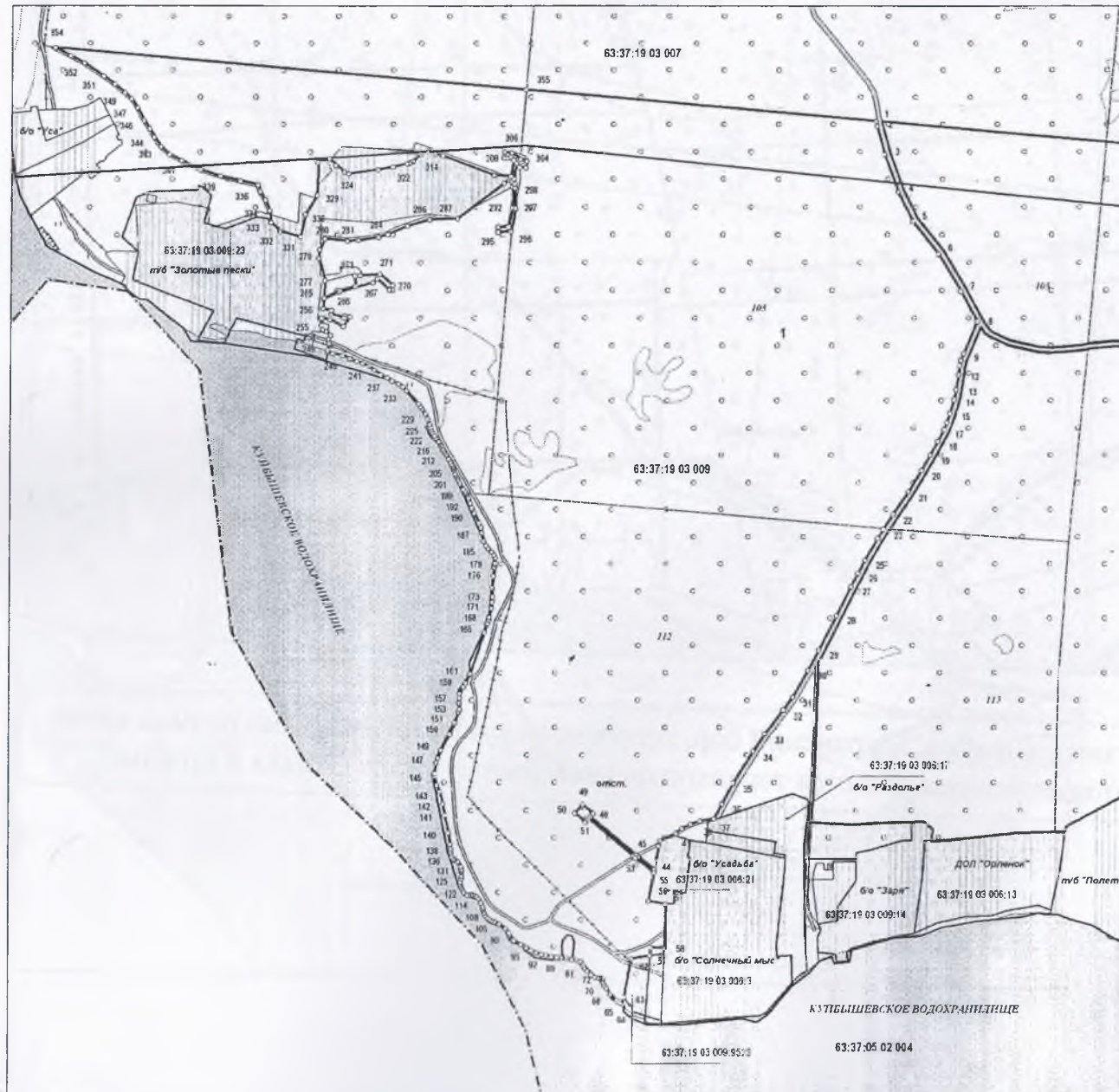
Рисунок.1.1 Самарская область, Шигонский район, Муранский бор, территории существующих баз отдыха вдоль Усинского залива в отношении которых устанавливается территориальная зона Р4 "Зона отдыха и туризма".