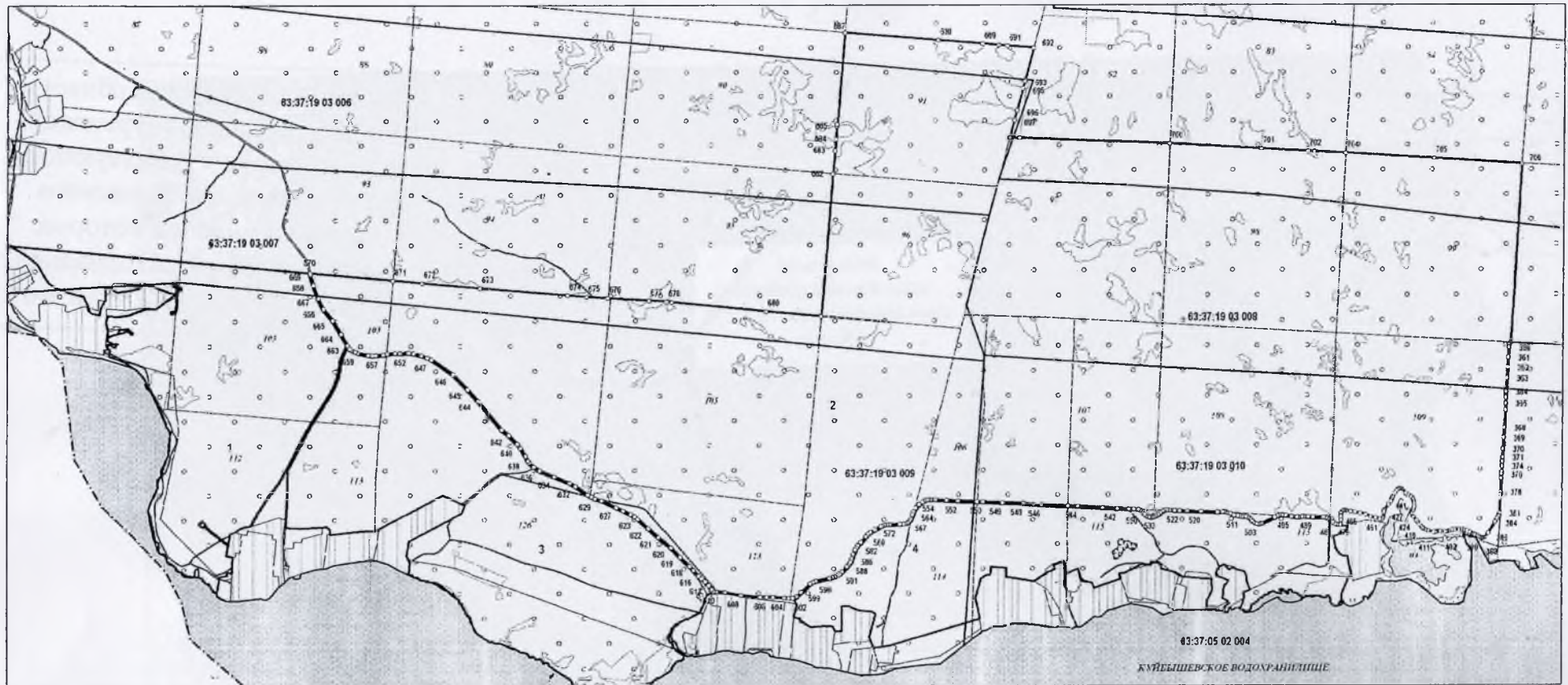
Рисунок.1.2 Самарская область, Шигонский район, Муранский бор, территории существующих баз отдыха вдоль Усинского залива в отношении которых устанавливается территориальная зона Р4 "Зона отдыха и туризма".