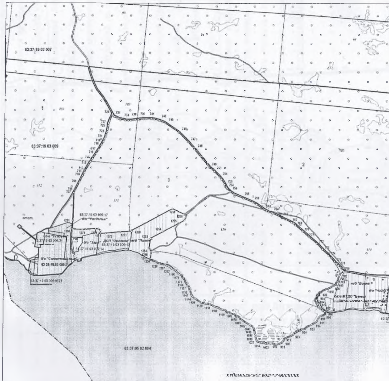
Рисунок.1.3 Самарская область, Шигонский район, Муранский бор, территории существующих баз отдыха вдоль Усинского залива в отношении которых устанавливается территориальная зона Р4 "Зона отдыха и туризма".