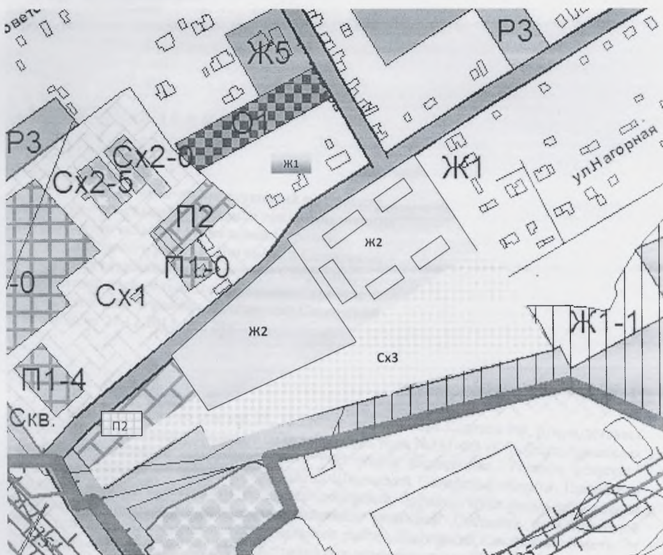
Рисунок.1 Улица Мельничная, Нагорная в с. Суринск.