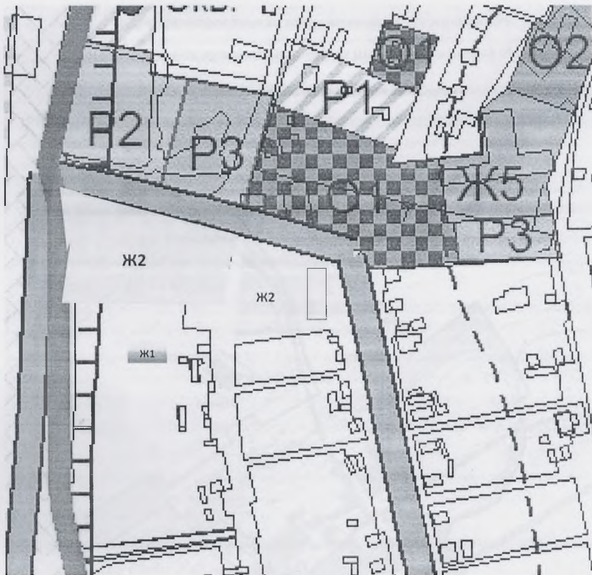
Рисунок.1 Улица Центральная в с. Байдеряково.